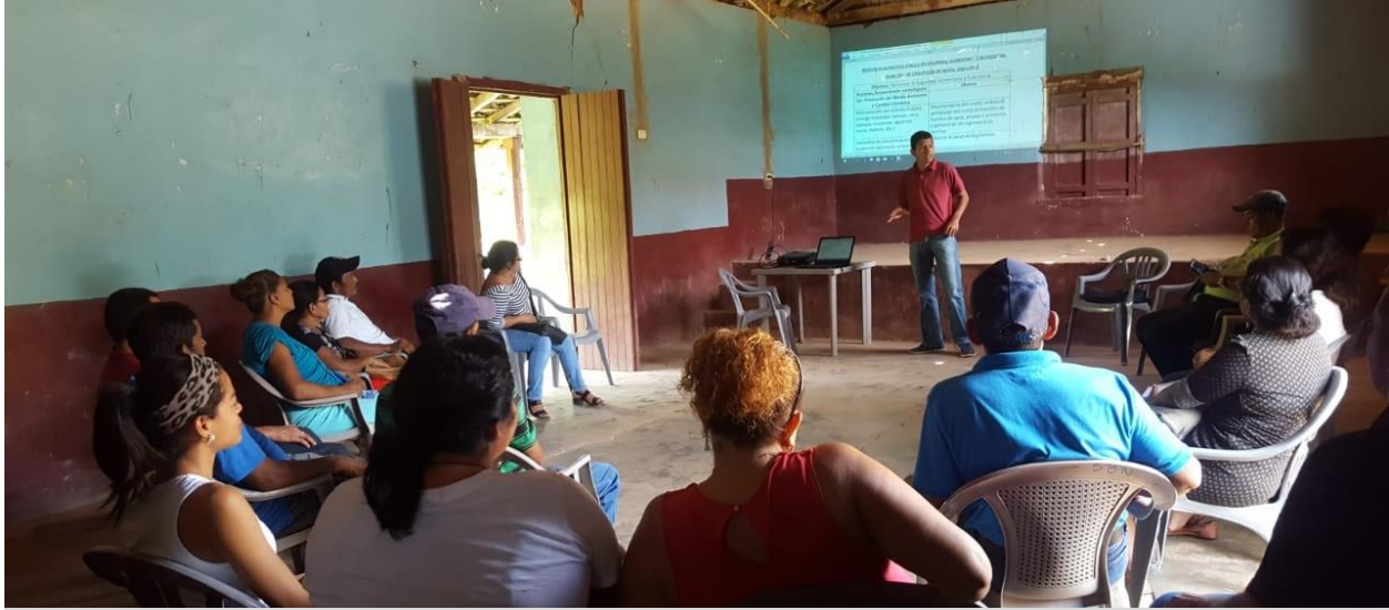
Socialización de la Política Municipal SAN-CC en el sector de San Benito

Una vez realizados los foros/asambleas de socialización comunitaria del borrador de la Propuesta de Política Municipal SAN-CC, es importante mencionar que, en todos los sectores, los/as líderes/as participantes expresaron estar de acuerdo con su contenido. Solo preguntaban algunos conceptos como política y SAN, los cuales, fuimos aclarando oportunamente.