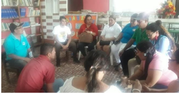
Taller "Diseño Estrategia de Incidencia MMSAN"

A continuación, se presentan los lineamientos estratégicos de la PyENSAN: