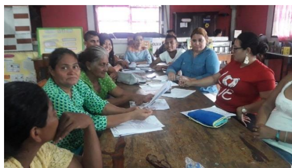
Taller de revisión y ajustes al borrador de Propuesta de Política Municipal SAN-CC

De forma específica, la presente Política Municipal de Seguridad Alimentaria y Nutricional, de Concepción de María, se ha enmarcado dentro de los Lineamientos: 2, 3, 7, 8, 9 y 10 , de la PyENSAN, en vista del contexto actual del municipio, y de las condiciones del gobierno local para la inversión y coordinación en el marco de la Política Municipal.