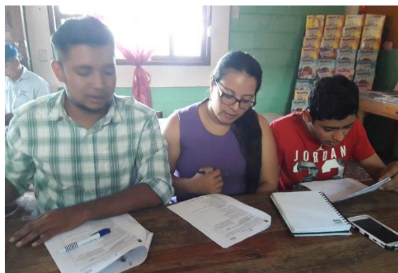
Taller "El Enfoque de Derechos Humanos en la SAN".

En este momento y coyunturalmente, se realizó el I Encuentro Nacional de MMSAN en la ciudad de La Ceiba, Atlántida, en la que participaron dos personas de la Mesa SAN de CdM, entre ellas la alcaldesa. Este fue un espacio de intercambio de experiencias, donde representantes de otras MMSAN, compartieron sus procesos de incidencia para la aprobación de políticas municipales SAN, y los procesos de incidencia para que los gobiernos municipales destinaran presupuesto anual, para la implementación de dichos instrumentos.