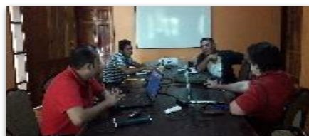
Momento 2 Definición del eje, objeto y objetivo de la experiencia a sistematizar