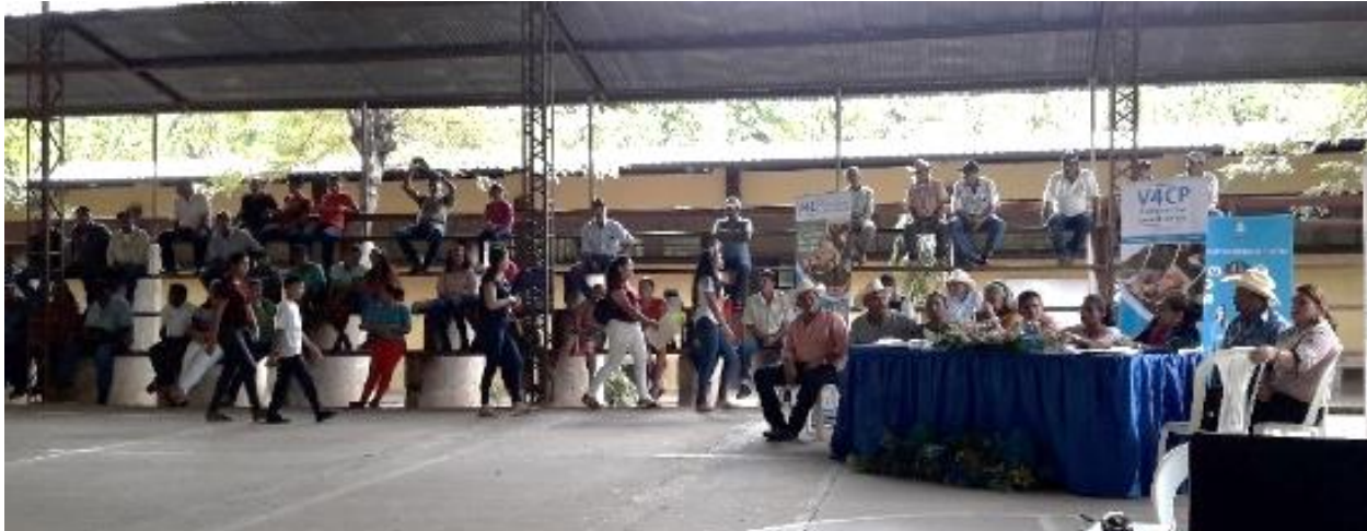
Cabildo abierto donde se aprobó la Política Municipal de Seguridad Alimentaria y Nutricional con Enfoque de Cambio Climático.

Asesoramos a la MMSAN con relación a la agenda y metodología para celebrar el cabildo abierto. En primer lugar, se acordó compartir los gastos de alimentación del evento con la alcaldía, ya que, se esperaba la participación de unas 350 personas. Se expresó que en el cabildo realizaríamos una exposición magistral de la Política.