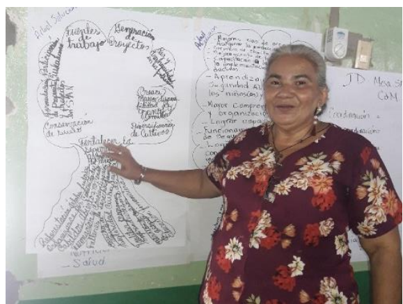
Regidora Municipal participando en el taller de análisis situación SAN.

El analizar la situación SAN en el municipio, permitió que, mediante las metodologías de Árbol del Problema y Árbol de Soluciones, diera claridad a los y las participantes en relación con las funciones de la MMSAN y establecer como meta, lograr la aprobación de la Política Municipal SAN-CC.