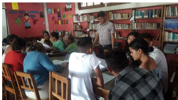
Taller de revisión y ajustes al borrador de Propuesta de Política Municipal SAN-CC

Es importante mencionar, que dentro de los lineamientos de la PyENSAN 2019-2030, se enmarcan los componentes, proyectos y acciones, contenidos en la Política Municipal de Seguridad Alimentaria y Nutricional, de Concepción de María.