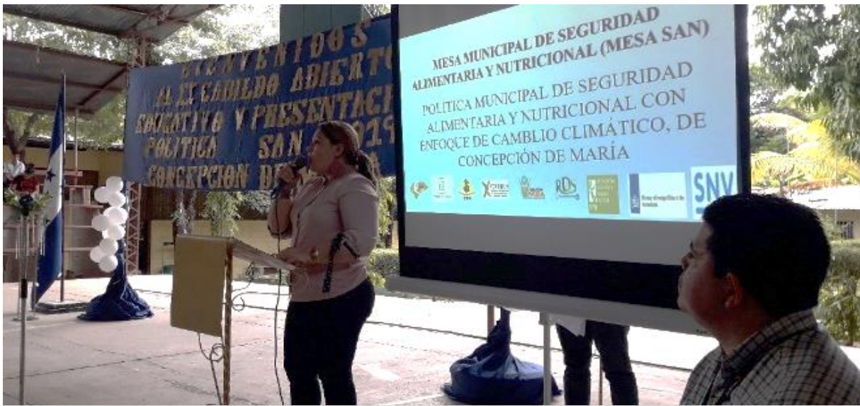
Cabildo abierto donde se aprobó la Política Municipal de Seguridad Alimentaria y Nutricional con Enfoque de Cambio Climático.

Asesoramos a la MMSAN con relación a la agenda y metodología para celebrar el cabildo abierto. En primer lugar, se acordó compartir los gastos de alimentación del evento con la alcaldía, ya que, se esperaba la participación de unas 350 personas. Se expresó que en el cabildo realizaríamos una exposición magistral de la Política.