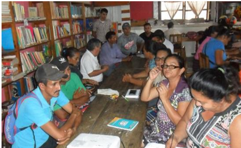
Socialización de la Política Municipal SAN-CC en el sector CdM Centro.

Una vez realizados los foros/asambleas de socialización comunitaria del borrador de la Propuesta de Política Municipal SAN-CC, es importante mencionar que, en todos los sectores, los/as líderes/as participantes expresaron estar de acuerdo con su contenido. Solo preguntaban algunos conceptos como política y SAN, los cuales, fuimos aclarando oportunamente.