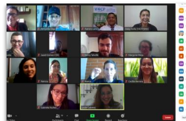
Momento 5 Elaboración del Informe de la Sistematización de Experiencias

Un momento determinante fue la consulta a los actores claves de la Mesa Municipal SAN, mediante la realización de un grupo focal virtual, donde se aplicó una herramienta encaminada a recolectar información y reflexionar sobre ella, en relación al contexto previo a la experiencia, nuestros aportes institucionales, las fortalezas y debilidades en el acompañamiento, los momentos más importantes, principales logros,