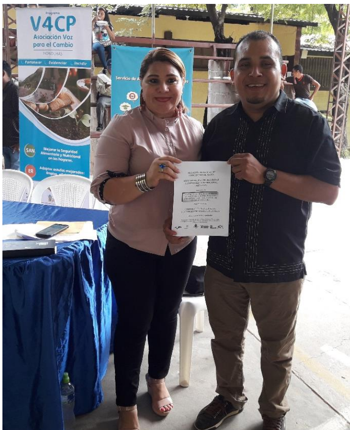
Cabildo abierto donde se aprobó la Política Municipal de Seguridad Alimentaria y Nutricional con Enfoque de Cambio Climático.