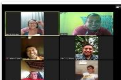
Momento 4 Espacios de consulta con Mesa SAN