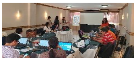
Momento 1 Conceptualización de la sistematización de experiencias

Se ordenó el proceso en sus diferentes momentos y actividades que llevaron a la aprobación de la Política Municipal de Seguridad Alimentaria y Nutricional con Enfoque de Cambio Climático.